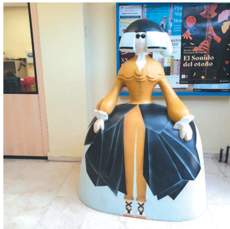
ubicada en el Mercado Municipal de Moratalaz.